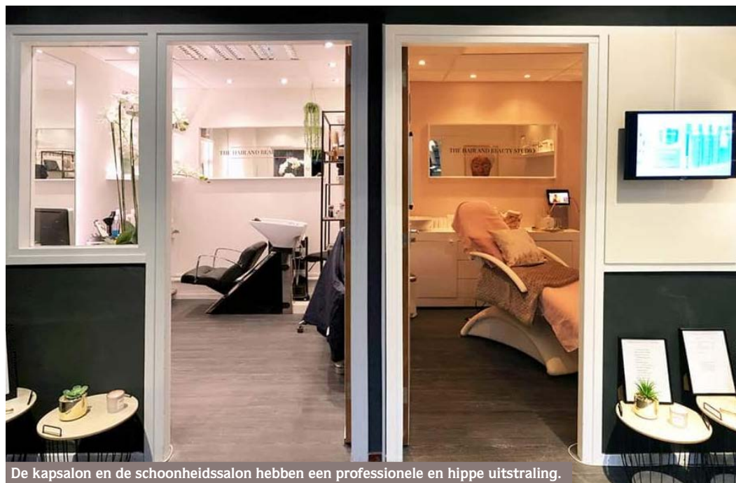
De kapsalon en de schoonheidssalon hebben een professionele en hippe uitstraling.